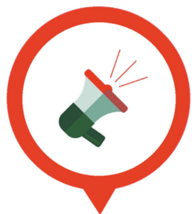
Service Alerte Citoyenne

L'alerte citoyenne de Sainte-Eulalie est un système automatisé d'alertes facilitant les communications